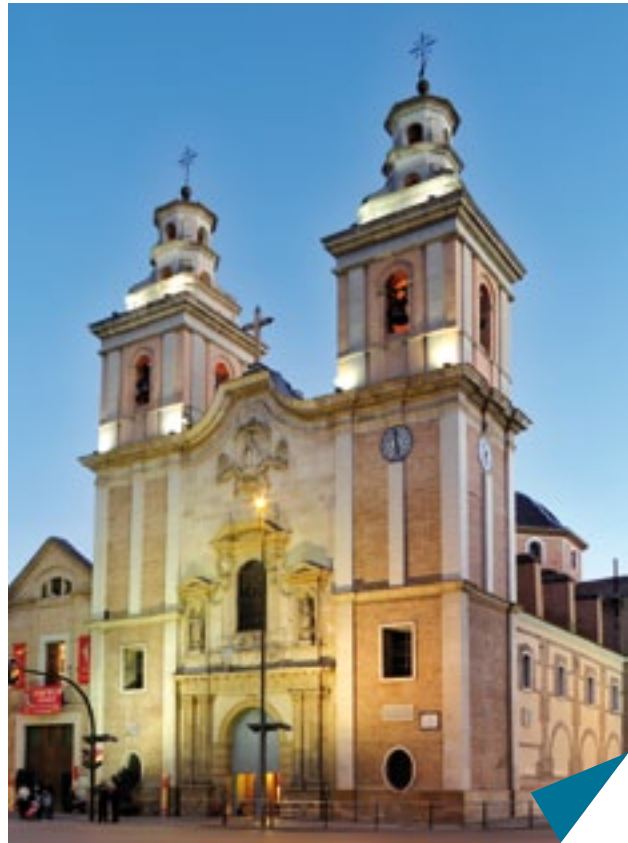
Iglesia Parroquial del Carmen. Siglo XVIII

Puerta de entrada a la ciudad para los viajeros en tren, El Carmen es el barrio en el que resplandece el Jardín de Floridablanca, primer que se construyó con fines de servicio público en toda España. Es un lugar cargado de historia, ya que se inició en 1786. Posteriormente, sería prueba del homenaje que Murcia deseaba rendir a uno de sus hijos más notable: José Moñino, conde de Floridablanca, Secretario de Estado, durante el reinado de Carlos III, y presidente de la Junta Suprema Central, creada en 1808, con motivo de la invasión napoleónica.